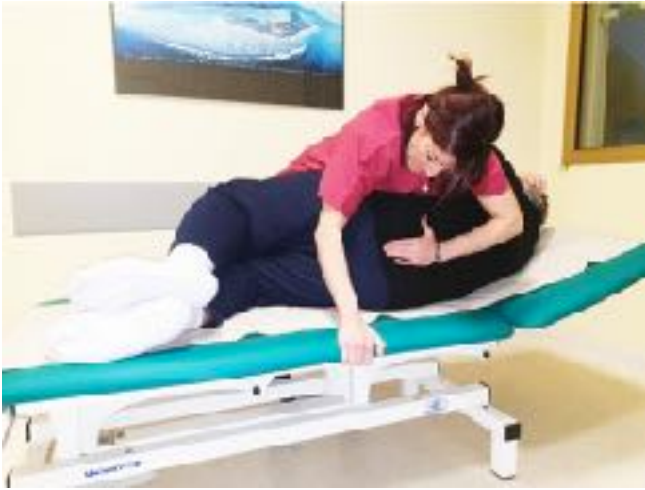
Figura 1 - Pompaggio del sacro (tecnica di Mc Kinnon)