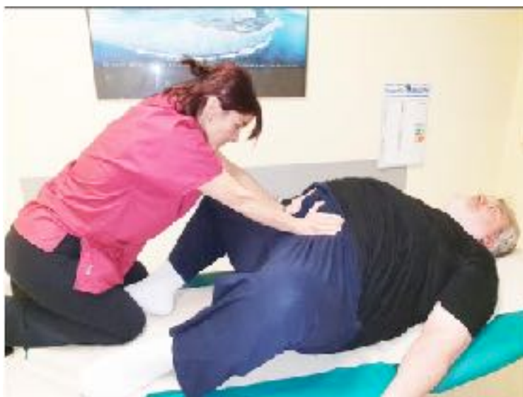
Figura 18 - Grande manovra dinamogenica