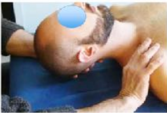
Figura 2 - Tecnica su OTS