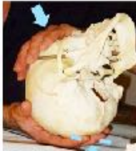
Figura 11 - Tecnica di espansione della base (seno sfeno petroso e tentorio del cervelletto)