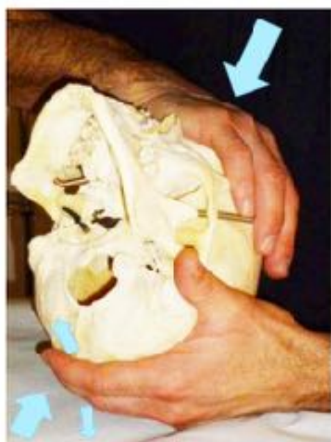
Figura 9 - Tecnica sui seni trasversi (linea nucale superiore)