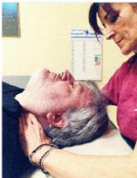
Figura 3 - Tecnica sulla fascia cervicale media