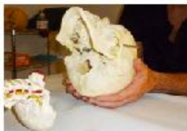
Figura 6 - Tecnica di detensione dei muscoli suboccipitali